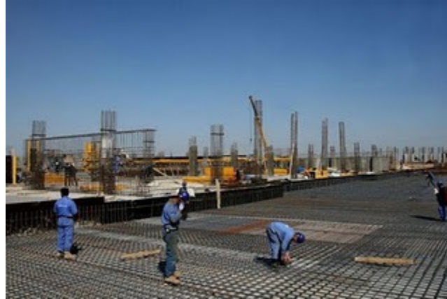
العمل في شباط 2011