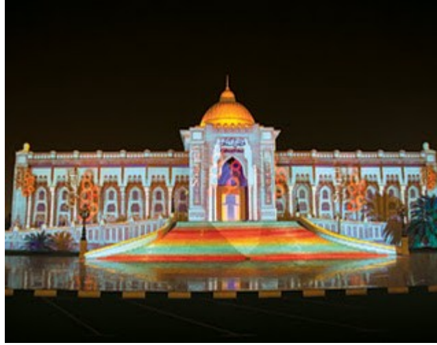
قصر ثقافة النجف تحفة معمارية والقبة الذهبية أكبر قبة في العالم